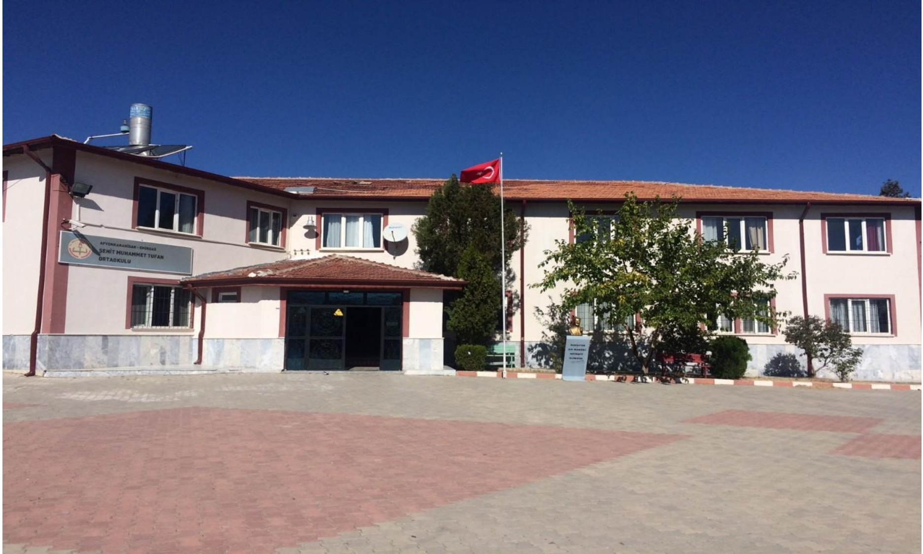
EMİRDAĞ ŞEHİT MUHAMMET TUFAN ORTAOKULU